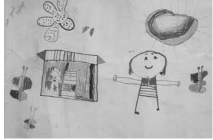
Tercera Etapa: Simbolismo Descriptivo.

Debemos conocer las etapas de desarrollo del dibujo libre y tenerlas