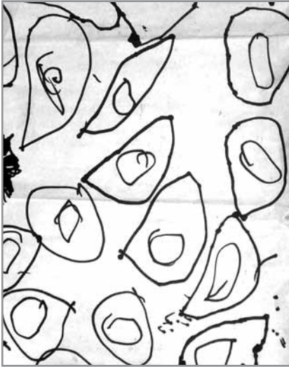
Primera etapa: Garabateo imitativo.

Ejemplo: una casa, un gato, las nubes. En esta etapa también repiten la misma figura por un tiempo, Esto lo hacen con el fin de perfeccionar su dibujo.