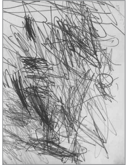
Primera etapa: Garabateo sin finalidad

parten de sus conocimientos, ya que se encuentran en constante búsqueda. Por ejemplo: Cuando el niño descubre que tiene ombligo, lo incorpora una y otra vez en sus dibujos.