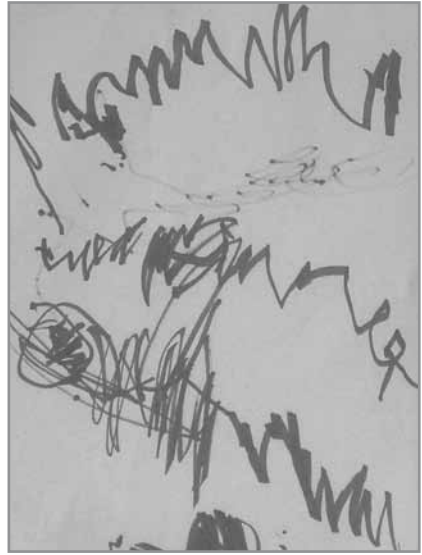
Primera etapa: Garabateo con sentido.

a las que le dan nombre. Ahora sus dibujos ya tienen nombres, ejemplo: Una pelotita puede representar a su papá, una rayita puede representar a su mamá.