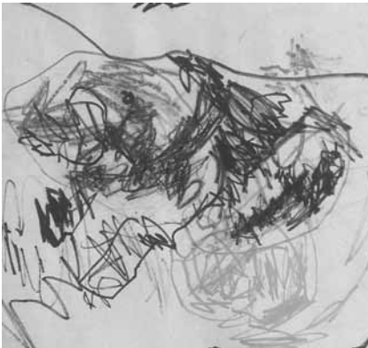
Primera etapa: Garabateo localizado.

Después continúan otras etapas, que no corresponden a la edad preescolar, y por eso no las describimos.